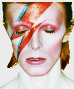
Aladdin Sane. The sixth studio album by English singer-songwriter David Bowie

David Bowie, original name David Robert Jones, (born January 8, 1947, London, England—died January 10, 2016, New York, New York, U.S.), British singer, songwriter, and actor who was most prominent in the 1970s and best known for his shifting personae and musical genre hopping.